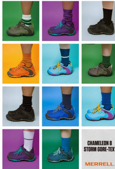
CHAMELEON 8 STORM GORE-TEX®