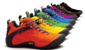
カメレオン 2 ストーム 日本限定色第二弾（2009）

「CHAMELEON 8 STORM GORE-TEX®」は、フェスシーンやアウトドアシーンで人気の王道ハイキングシューズ「CHAMELEON STORM」シリーズのアップデートモデルです。今回のアップデートでは、フェスシーンで親しまれていた「CHAMELEON 2 STORM」のシンプルだが独創性に溢れたデザインを踏襲し、当時のカメレオンファンの方々には懐かしのビジュアルとなっています。様々なファッションシーンに取り入れていただける豊富なカラーリングはそのままに、アウトドアシューズならではの機能性を体感いただけます。