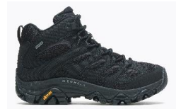
モアブ 3 シンセティック ミッド ゴア