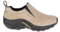
ジャングル モック

MERRELL YouTube チャンネル： https://www.youtube.com/channel/UC13E10yckCdRU8vCAhe1I-Q