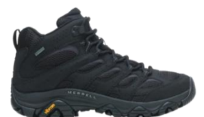
モアブ 3 シンセティック ミッド ゴアテックス®