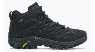
モアブ 3 シンセティック ミッド ゴアテックス