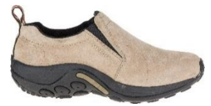
ジャングル モック

MERRELL YouTube チャンネル : https://www.youtube.com/channel/UC13E10yckCdRU8vCAhe1I-Q