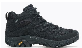
モアブ 3 シンセティック ミッド ゴアテックス