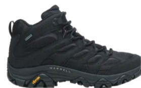
モアブ 3 シンセティック ミッド ゴアテックス