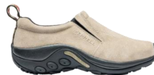
ジャングル モック

世界 160 カ国で愛され続けるアメリカ発祥のアウトドアブランド。1981 年に、カスタムメイドのカウボーイブーツの職人ランディ・メレルが職人としての腕を試すため、ハイキングブーツを作ったことから MERRELL の歴史は始まりました。MERRELL は創業から常にこれまでにない「新しさ」を追求し続け、ハイキングブーツやトレイルランニングシューズ、スポーツサンダルなど、アウトドアからライフスタイルまで、多彩なシューズを展開しています。世界中のバックパッカーから定評のある「モアブ」シリーズや、1998 年の登場以来、累計販売 1,700 万足を超える「ジャングルモック」シリーズ、アウトドアシーンからタウンユースまで幅広い用途で人気の「カメレオン」シリーズは MERRELL の代表作とも言えます。2021 年の MERRELL 誕生 40 周年アニバーサリーヤーを経た次の 40 年もあらゆる人と自然を楽しみ、自然を大切にしていきたい。そんな思いを抱きながら、MERRELL は歩み続けます。