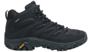
モアブ 3 シンセティック ミッド ゴアテックス