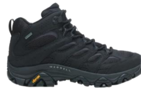
モアブ 3 シンセティック ミッド ゴアテックス