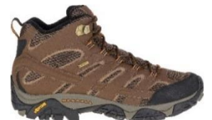
モアブ 2 ミッド ゴアテックス