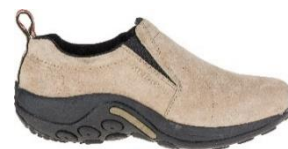
ジャングル モック

世界 160 カ国で愛され続けるアメリカ発祥のアウトドアブランド。1981 年に、カスタムメイドのカウボーイブーツの職人ランディ・メレルが職人としての腕を試すため、ハイキングブーツを作ったことから MERRELL の歴史は始まりました。MERRELL は創業から常にこれまでにない「新しさ」を追求し続け、ハイキングブーツやトレイルランニングシューズ、スポーツサンダルなど、アウトドアからライフスタイルまで、多彩なシューズを展開しています。世界中のバックパッカーから定評のある「モアブ」シリーズや、1998 年の登場以来、累計販売 1,700 万足を超える「ジャングルモック」シリーズ、アウトドアシーンからタウンユースまで幅広い用途で人気の「カメレオン」シリーズは MERRELL の代表作とも言えます。2021 年の MERRELL 誕生 40 周年アニバーサリーを経た次の 40 年も、あらゆる人と自然を楽しみ、自然を大切にしていきたい。そんな思いを抱きながら、MERRELL は歩み続けます。