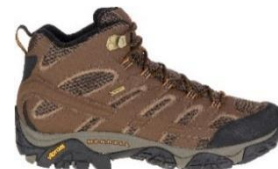
モアブ 2 ミッド ゴアテックス