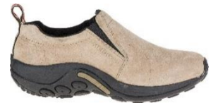
ジャングル モック

世界 160 カ国で愛され続けるアメリカ発祥のアウトドアブランド。1981 年に、カスタムメイドのカウボーイブーツの職人ランディ・メレルが職人としての腕を試すため、ハイキングブーツを作ったことから MERRELL の歴史は始まりました。MERRELL は創業から常にこれまでにない「新しさ」を追求し続け、ハイキングブーツやトレイルランニングシューズ、スポーツサンダルなど、アウトドアからライフスタイルまで、多彩なシューズを展開しています。世界中のバックパッカーから定評のある「モアブ」シリーズや、1998 年の登場以来、累計販売 1,700 万足を超える「ジャングルモック」シリーズ、アウトドアシーンからタウンユースまで幅広い用途で人気の「カメレオン」シリーズは MERRELL の代表作とも言えます。2021 年の MERRELL 誕生 40 周年アニバーサリーヤーを経た次の 40 年も、あらゆる人と自然を楽しみ、自然を大切にしていきたい。そんな思いを抱きながら、MERRELL は歩み続けます。