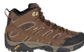
モアブ 2 ミッド ゴアテックス