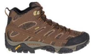
モアブ 2 ミッド ゴアテックス