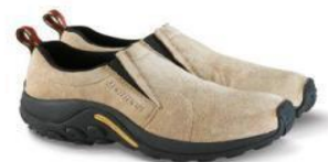
ジャングルモック

MERRELL HISTORY : http://www.merrell.jp/about/index.html