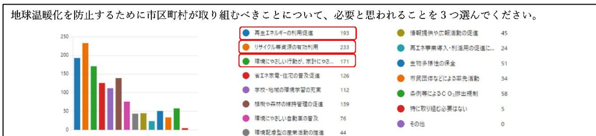
当日展示する「大学生の環境意識調査」より一部抜粋

また、本学の大学生を対象として行った SDGs ならびに地球温暖化を抑制するための CO2排出削減についての意識調査の結果をまとめたパネル展示も実施します。学生が環境問題についてどのような考えを持っているのか、どのように対応しようと思っているのかを明らかにし、学生が環境活動に参加しやすくするための課題と改善策を報告します。