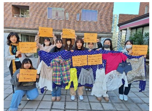
学内でオレンジデーキャンペーンを実施した学生達

本学ではこのキャンペーンに賛同し、2016年度より本郷キャンパス内でオリジナル賛同イベントを開催してきました。本年度は12月1日・7日の2日間にわたり、本学本郷キャンパス内にて、学内におけるキャンペーンポスターの掲示および啓発グッズの配布を行いました。また、女性に対する暴力反対に関するメッセージを掲げた写真を撮影し、SNSにハッシュタグをつけてアップロードすることを学生に呼びかけ、キャンペーンの周知に努めました。今年は、性暴力被害者が責められる二次被害を止めるために「そのとき何を着ていたか」は関係ないというメッセージを発信する服の展示も行いました。