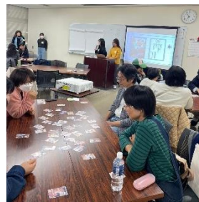
参加者で盛り上がったワークショップ

※甲斐田教授が監修し、本学の学生が認定NPO法人国際子ども権利センター（シーライツ）のインターンとして参加し制作。