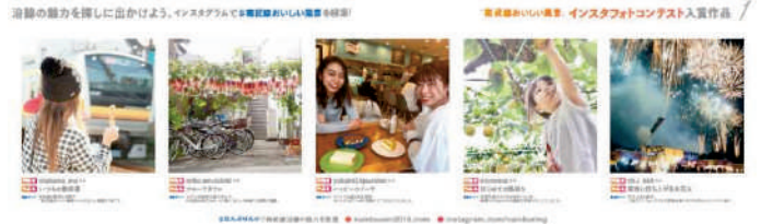
※車両掲載イメージ