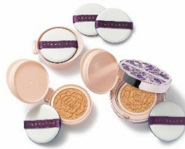
ザ・フェイスショップ 1:00~/17:00~