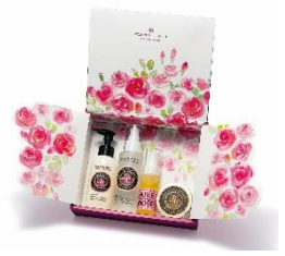
ローズ・ド・マラケシュ 2:00~/19:00~