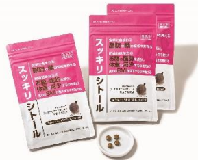
スッキリシトール (サプリメント) 11:00~