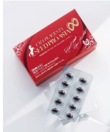
馬プラセンタシードプロアスタ (サプリメント) 0:00~/8:00~/12:00~/ 20:00~/22:00~