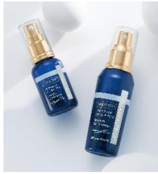
コラポーテ (美容液) 0:00~/7:00~/10:00~/ 14:00~/22:00~