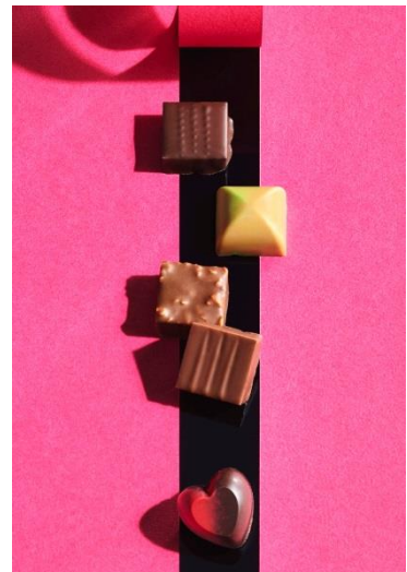
高島屋セレクション バレンタインコフレ(8種計8個入)・・・3,564円