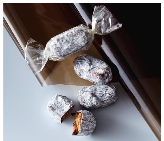
ピレネーのサラミショコラ(6個入)・・・1,944円