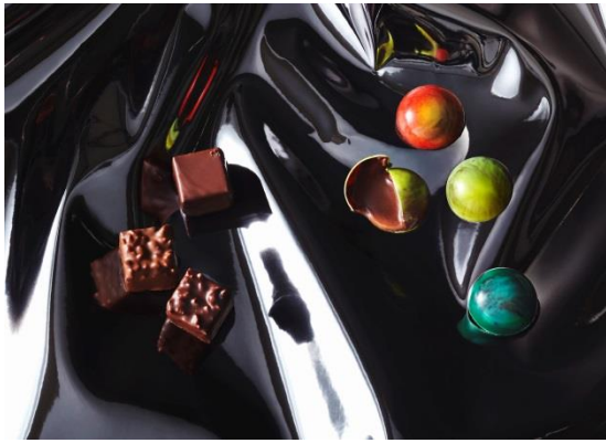
左)ロシェ(3種計16個入)・・・5,940円