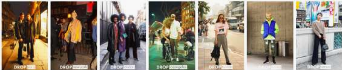
@drop_paris @drop_newyork @drop_london @drop_losangeles @drop_taiwan @drop_korea @drop_kansai

新たに開設されるアカウントは、パリやニューヨーク、韓国などの7つのキーとなる都市を網羅。いち早くストリートの顔（＝アイコン）を発掘し、スナップを通じて各エリアに根付くリアルな表情を写し出します。さらに、中国やバンコク、ベトナムのアカウントも年内に開設され、更なるグローバル展開を控えます。