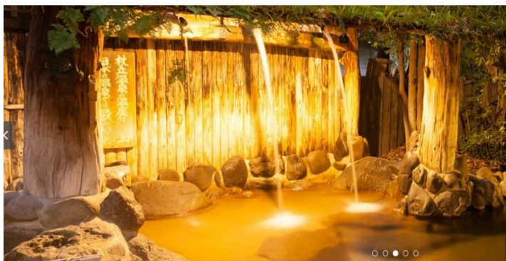
▲露天風呂・長寿霊泉

「米屋別荘」紹介ページ: https://www.ikyuu.com/00002741/