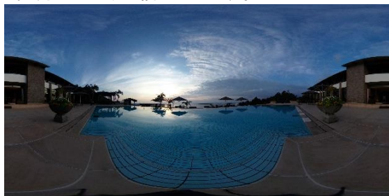
sankara hotel & spa 屋久島(「RICOH THETA」にて撮影)

高級ホテル・旅館の予約サイト『一休.com』(https://www.ikyuu.com/)の株式会社一休(本社:東京都港区、代表取締役社長:榑 淳、以下一休)が運営するトラベルWEBマガジン『一休コンシェルジュ』は、株式会社リコー(本社:東京都大田区、代表取締役社長執行役員:山下良則)とのコラボコンテンツ【「一休コンシェルジュ」×「RICOH THETA」ここに贅沢な絶景時間】を、2019年4月23日より配信いたします。