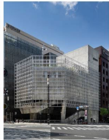
Ginza Sony Park