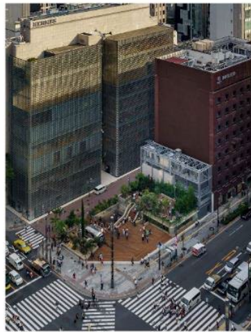
Ginza Sony Park