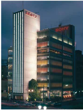
Sony Building 1966.4 - 2017.3