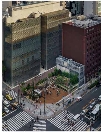
Ginza Sony Park 2018.8 - 2021.9