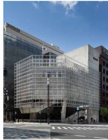
Ginza Sony Park 2025 -

Ginza Sony Park プロジェクトは、「街に開かれた施設」をコンセプトに 50 年以上にわたって銀座の街と歩んだソニービルを建て替えるプロジェクトです。