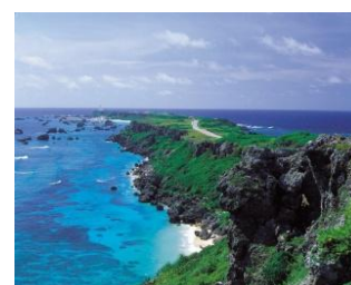
宮古島 東平安名崎

沖縄観光コンベンションビューローでは、土日祝限定(各日先着100名様)で、スタンプラリーにご参加いただいた方に、マハエちゃんシールを差し上げます。(期間中のみ土日祝営業)