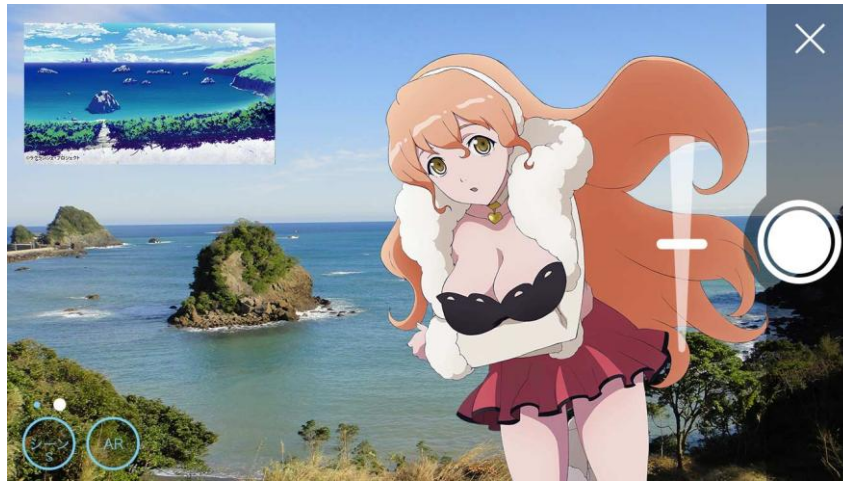
スマートフォンアプリ「舞台めぐり」ARキャラ写真画面