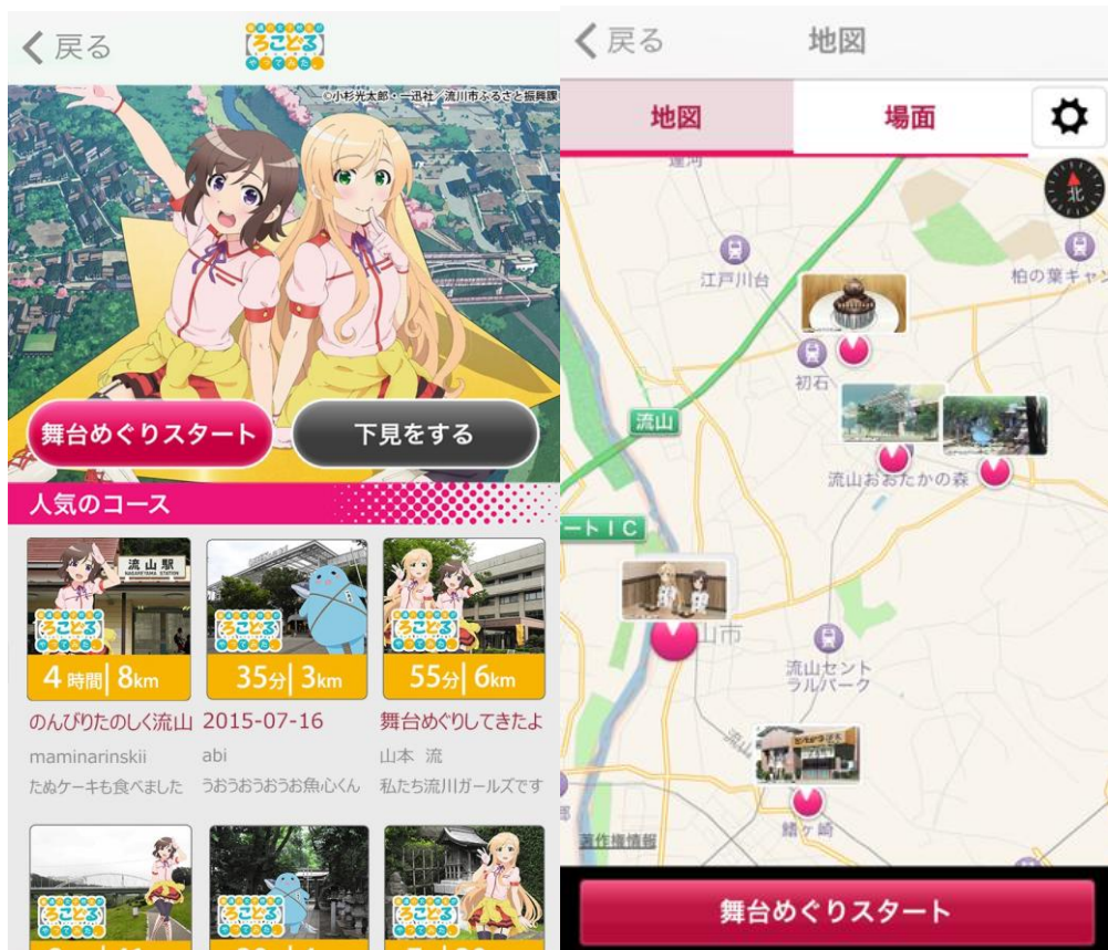
スマートフォンアプリ「舞台めぐり」画面