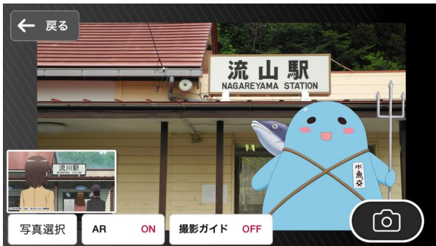
スマートフォンアプリ「舞台めぐり」ARキャラ写真画面