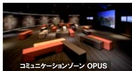
コミュニケーションゾーン OPUS

東京・銀座 ソニービルでは、 8F コミュニケーションゾーン OPUS(オーパス)にて、 5月9日～30日の毎週金曜日に、 200インチの大画面・フルハイビジョン画質で、 ソニーミュージックグループ所属アーティストのライブ映像 をノーカットで上映致します。ぜひご体験ください。