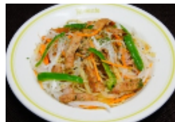
スパムとツナのチャンプルー風

詳しくはこちら： http://www.sonybuilding.jp/restaurant/aldente/index.html