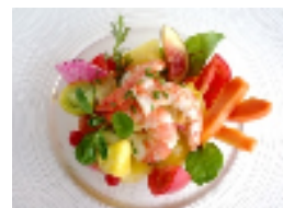
海老と沖縄のトロピカルフルーツ、 フルーツマトのサラダ仕立て

イチオシは前菜の「海老と沖縄のトロピカルフルーツ、フルーツマトのサラダ仕立て」。スティックパインやパパイヤ、パッションフルーツなど沖縄から取り寄せたフルーツをお楽しみいただけます。ドレッシングにはシークワサーを使用していますので、さっぱりとお召し上がりいただけます。