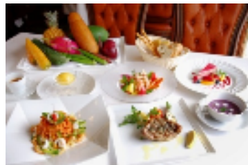
沖縄フェアコース

詳しくはこちら： http://www.sonybuilding.jp/restaurant/sabatini/index.html