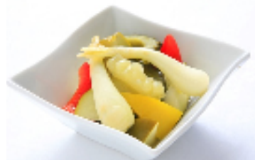
沖縄野菜の自家製ピクルス

詳しくはこちら： http://www.sonybuilding.jp/restaurant/cardinal/index.html