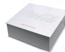
初回限定パッケージ イメージ

※本製品は The Coca-Cola Company からライセンスを受けたアルク・インターナショナルにより、製造されたものです。