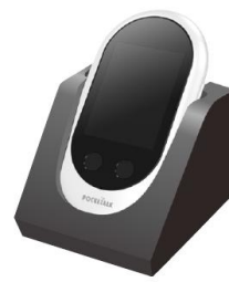
専用クレードル 2,880円