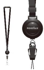
専用ネックストラップ 1,500円 ※価格は全て税別