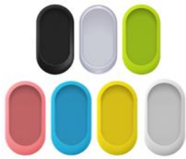
専用シリコンケース 全7色 各1,880円

ご要望の多かった、「ポケットーク」のカバーやストラップ等のオプション品も充実したラインアップで新登場します。