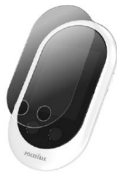
専用画面保護シール 880円