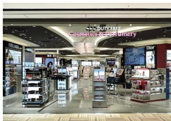
Fa-So-La DUTY FREE Cosmetics & Perfume 本館