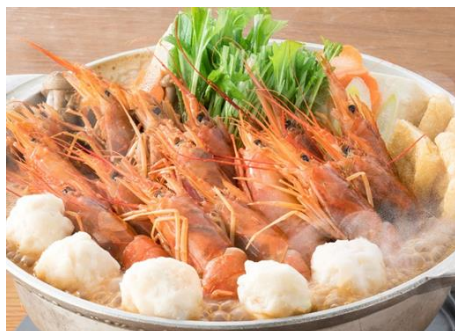
上方海老轟頂鍋 1人前1,490円(税抜)