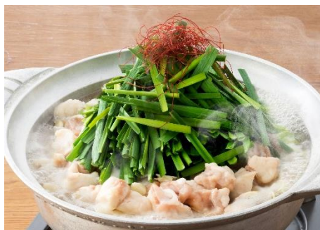
山盛りにらもつ鍋 1人前790円(税抜)

海老、ブリ、サーモン、帆立、を贅沢に使用したお鍋。海鮮の旨味が野菜に染み、箸が止まらない逸品。