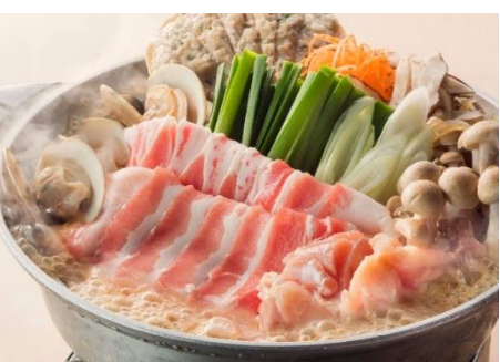
名物轟頂鍋 1人前890円(税抜)

山盛りのニラがインパクト抜群。ぷりっぷりのモツにシャキシャキのニラ。寒い冬に元気が出るお鍋です。