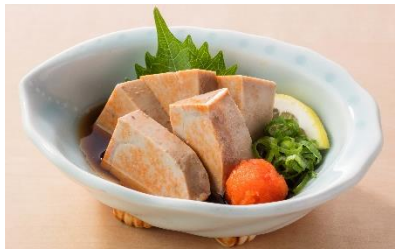
あん肝ポン酢 590円(税抜)