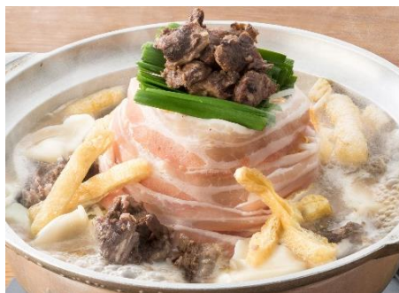
牛すじぼっかけ鍋 1人前690円(税抜)

お好みでぶどう山椒のシビレを効かせてお召上がりください。甘辛いぼっかけと具材の相性は抜群。