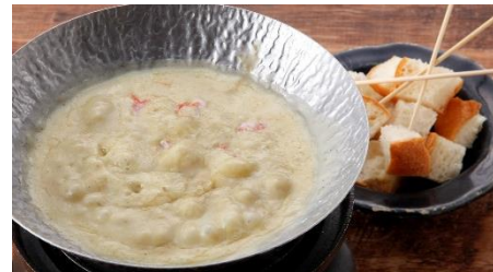
蟹味噌のチーズフォンデュ 890円(税抜)