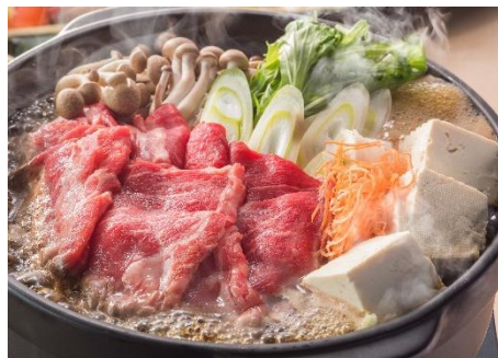
牛肉すき焼き 1人前990円(税抜)

創業以来愛され続けている名物鍋。特製味噌出汁にハマグリや豚肉、つくね、鶏肉、お野菜の具沢山鍋。