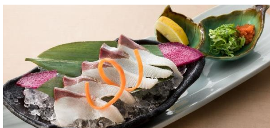
鰯炙り造り 690円(税抜)