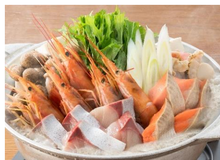
海鮮鍋 1人前1,290円(税抜)

お好みでぶどう山椒のシビレを効かせてお召上がりください。甘辛いぼっかけと具材の相性は抜群。