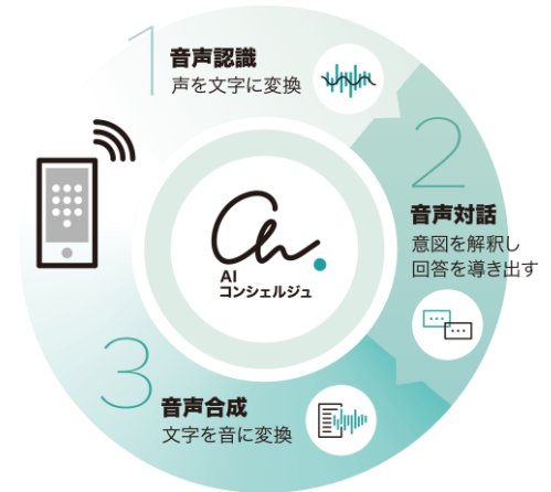
『AI コンシェルジュ®』サービスイメージ

AI コンシェルジュ® : https://www.tactinc.jp/service/ai