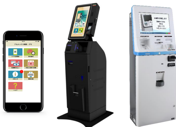
写真左から：『Sma-Pa アプリ』『Sma-pa TERMINAL』『FIT-A』

両社は病院・クリニックの業務を効率化し、病院スタッフ様がよりお客様の対応に注力いただけるよう、今後も病院・クリニックの DX 化を推進してまいります。