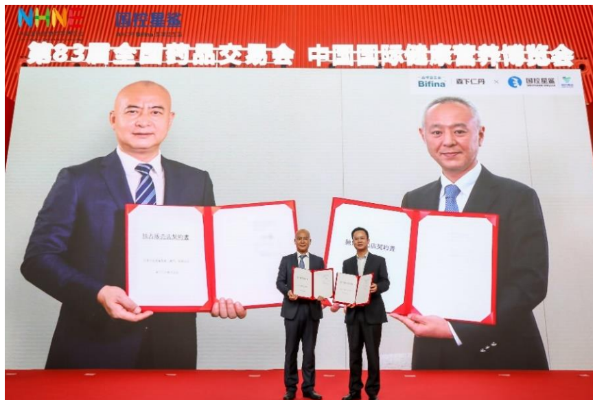
ビデオレターによるパートナーシップ締結セレモニーの様子（2020年9月24日）

当社は、タイ、ベトナム、フィリピン、シンガポール、ラオス、台湾、香港で海外展開し、「ビフィーナ」などをはじめとするヘルスケア製品を通じて各国各地域の人々の健康に寄り添ってまいりました。健康に対する人々の意識が特に高い中国市場における需要にも応えるべく「ビフィーナR」「ビフィーナS」「ビフィーナEX」をお届けし、中国の方々のヘルスケアに貢献いたします。中国プロバイオティクス消費量の大部分を占める19省での販売を中心としながら、中国全土へのシェア拡大を目指してまいります。