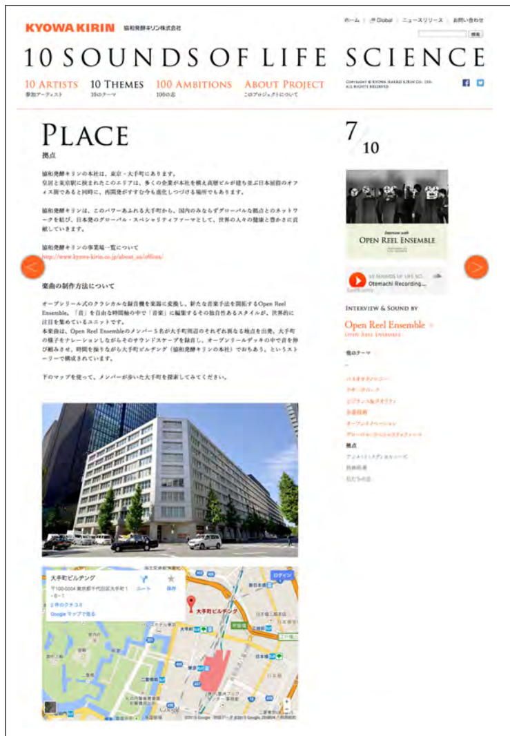
「10 THEMES」：各テーマの詳細をご紹介します。