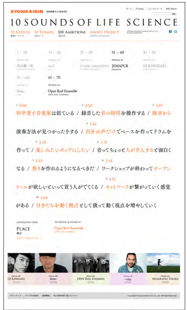
「100 AMBITIONS」：Open Reel Ensembleの10の言葉をお楽しみいただけます。