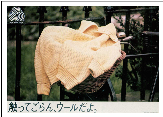
<ポスター/ザ・ウールマーク・カンパニー/1982>

著書 『そのとき風が四人の胸を串刺しにした』 ウェスト・ヴィレッジ 『閑休自在 悠々自滴 異口同飲』 美術出版社