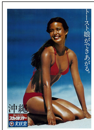
<ポスター/全日本空輸/1980>