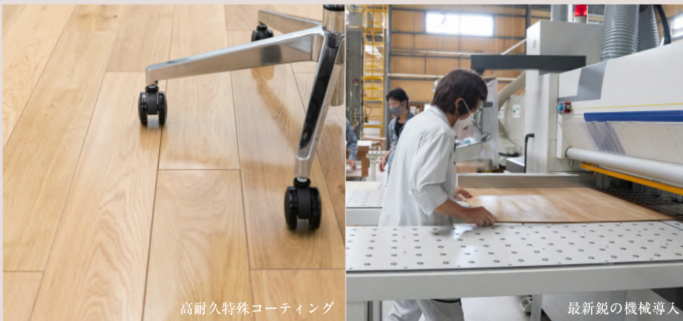
高耐久特殊コーティング