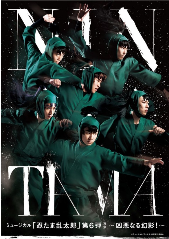
ミュージカル「忍たま乱太郎」第6弾 再演 ～凶悪なる幻影！～