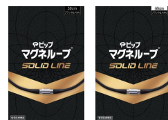
販売名 ピップマグネループEX