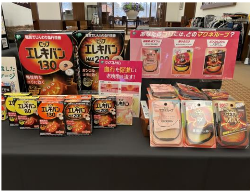
血行を改善しコリを解消するブランド「ピップエレキバン」「ピップマグネルーブ」のブースの様子