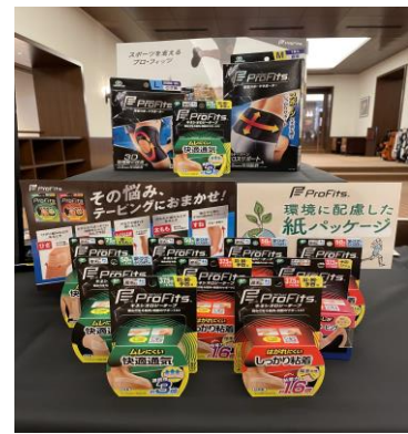
スポーツケア用品ブランド「プロ・フィッツ」のブースの様子