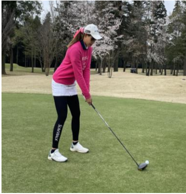
オリジナルの「スリムウォーク Beau-Acty 美脚&美尻レギンス」を着用している選手の様子

◆着圧レッグウェアブランド「スリムウォーク」では、ロゴ入りオリジナルの「スリムウォーク Beau-Acty 美脚&美尻レギンス」を提供し、プレー中に着用していただきました。