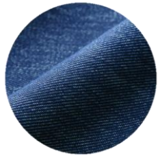
【デニム風ネイビー】