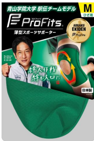
※デザインはイメージです

PIP株式会社（本社：大阪市中央区、代表取締役社長：松浦由治）のスポーツケア用品ブランド「プロ・フィッツ」はAmazon限定で、青山学院大学陸上競技部 駅伝チームとコラボしたひざ用サポーターを発売します。本製品は2020年12月29日(火)より予約開始を予定しています。数量限定での発売となっており、出荷開始は3月下旬を予定しています。また、2020年12月29日(火)より、プロ・フィッツTwitter公式アカウントにて「青学応援キャンペーン」を実施します。