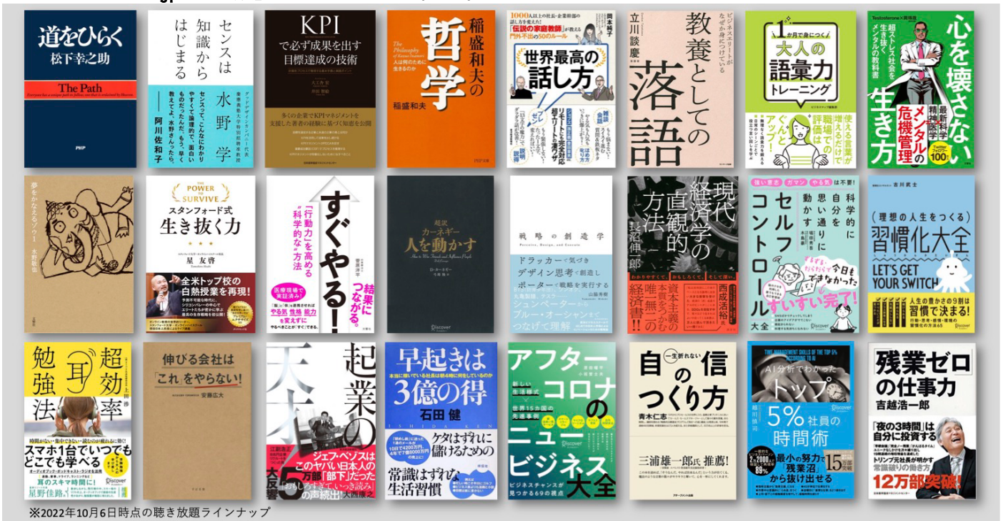
※2022年10月6日時点の聴き放題ラインナップ