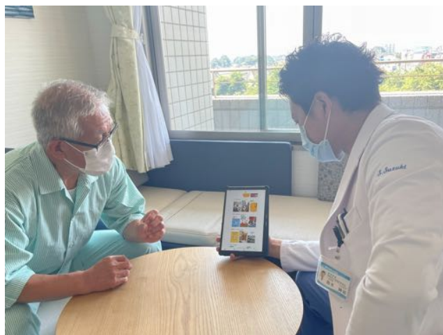
院内での利用イメージ