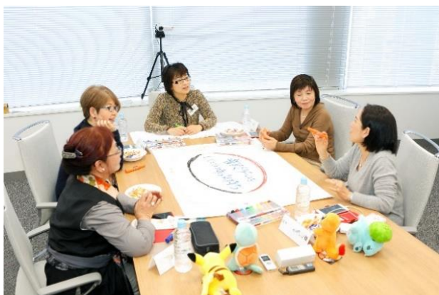
「ハルメク 生きかた上手研究所」による モニター座談会

※新型コロナウイルス感染症の影響により、現在は一部でオンライン会議システムを活用した「オンライン座談会」を開催中。デジタルスキルの低いシニアにも参加していただけるよう、手厚いサポートを行いながら運営しています。