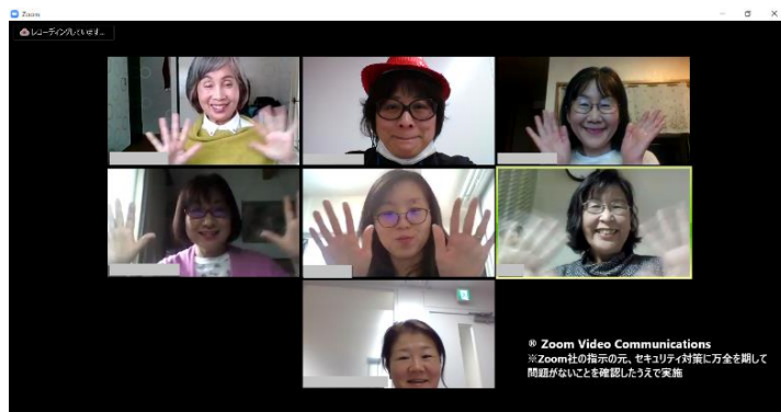
新型コロナウイルス感染症対策のための 「オンライン座談会」