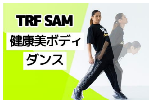
ハルメク WEB オリジナル動画 TRF・SAM の健康美ボディダンス