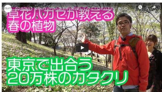
「草花散歩」もオンラインに

※新型コロナウイルス感染症の影響により、2月後半より全イベントを中止・延期中。代わって、人気講座の一部を「オンライン講座」としてYouTube上で公開しています。「草花散歩」「エッセーの書き方講座」をはじめ、体操など、家にいながら学んだり、楽しんだりしていただけるコンテンツを企画しています。動画はYouTubeの「ハルメク公式チャンネル」にアーカイブしています。