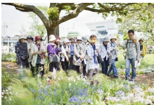
定番人気イベントの「草花散歩」

ハルメクオリジナルのイベントは、企画から運営まですべて自社スタッフで行っており、その開催数は年間約200回に上ります。雑誌「ハルメク」で連載を持つ講師による講座も人気で、テレビでも話題の「きくち体操」の講演会等、参加者が1,000名以上になる大規模なイベントも定期的に開催しています。