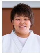
すぎもと みか 杉本 美香 ロンドンオリンピック 女子柔道78kg 超級 銀メダリスト