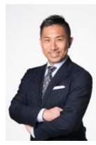
まえその まさきよ 前園 真聖 アトランタオリンピック サッカー日本代表