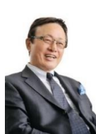
かまもと くにしげ 釜本 邦茂 メキシコシティオリンピック サッカー銅メダリスト