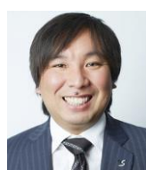
さとざき ともや 里崎 智也 元プロ野球選手