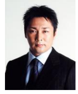
もとき だいすけ 元木 大介 元プロ野球選手