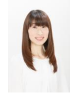
はらだ ゆか 原田 裕花 アトランタオリンピック バスケットボール日本代表