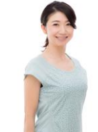
いちはし あり 市橋 有里 シドニーオリンピック 女子マラソン日本代表