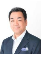
まさきは ひろみ 槇原 寛己 元プロ野球選手