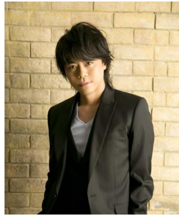
なみかわ だいすけ 浪川 大輔 声優 「ハイキュー!!」 及川徹 役