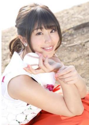
いなむら あみ 稲村 亜美 タレント