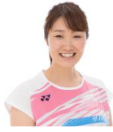
ひろせ えりこ 廣瀬 栄理子 北京オリンピック バドミントン シングルス ベスト16