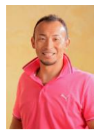
ひろみち じゆん 廣道 純 シドニーパラリンピック 800m銀メダリスト