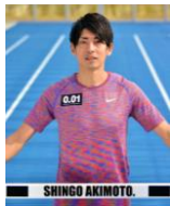
あきもと しんご 秋本 真吾 元陸上競技選手 200mハードル アジア記録保持者