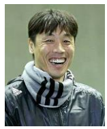
すずき たかひろ 鈴木 尚広 元プロ野球選手