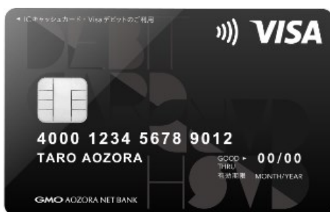
【当社標準デザイン】